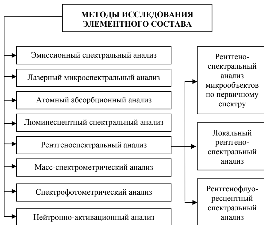
Рис. 2. Система методов исследования элементного состава веществ и материалов

Элементный состав широкого круга веществ и материалов преимущественно определяется анализами: спектральным эмиссионным, лазерным микроспектральным, атомным абсорбционным, рентгеновским микроспектральным и некоторыми другими (рис. 2).