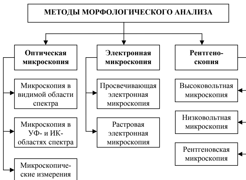
Рис. 1. Схема микроскопических методов исследования веществ и материалов

Наиболее распространенными методами морфоанализа в КИВМИ являются микроскопические. В экспертной практике используются и оптические микроскопы, изображение в которых образуется за счет взаимодействия с объектом ультрафиолетовых, видимых или инфракрасных лучей, и микроскопы электронные для работ, связанных с взаимодействием объекта с пучком электронов, и микроскопы рентгеновские, которые в практике экспертизы используются лишь эпизодически (рис. 1).